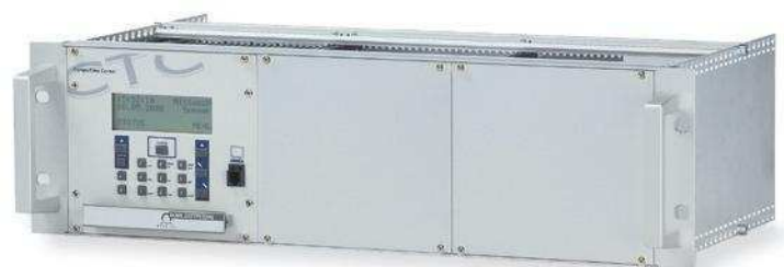
19" Akku-Modul AB M24-3.2