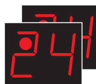
MSA SC xxx.750